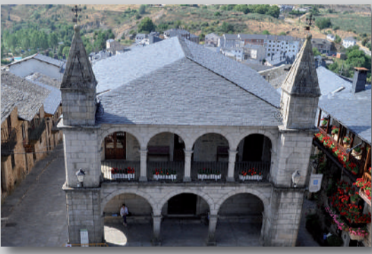
AYUNTAMIENTO Presidiendo la Plaza Mayor de Puebla de Sanabria se encuentra esta sobria edificación de la época de los Reyes Católicos. Consta de dos plantas porticadas con elegantes torreonos a ambos lados.