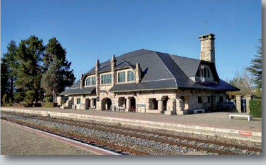
ESTACIÓN DE FERROCARRIL Magnífica construcción de piedra de mediados del s. XX.