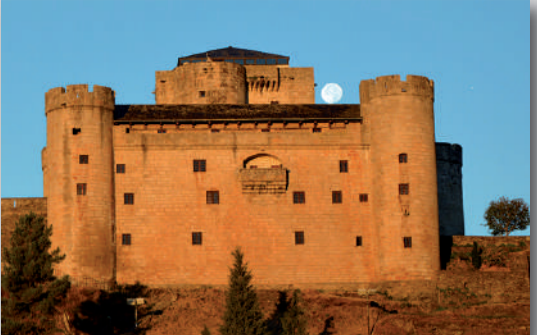
CASTILLO DE PUEBLA DE SANABRIA Construido a mediados del s. XV por orden de don Rodrigo Alonso de Pimental y doña María de Truchete (IV Condes de Benavente). Se trata de un Castillo-fortaleza construido en sillera de granito con un recinto amurallado de planta cuadrangular y una torre central. Dentro del recinto encontramos: CASA DEL GOBERNADOR, centro de recepción de visitantes y Oficina de Turismo; TORRE DEL HOMENAJE, con información histórica; y CASA DE CULTURA, con la Biblioteca Municipal, Sala de Exposiciones y Salón de Actos.