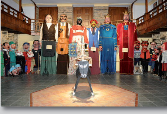
MUSEO DE GIGANTES Y CABEZUDOS Alberga la Agrupación de Gigantes y Cabezudos de Puebla de Sanabria, tradición muy importante en la Villa que data de mediados del s. XIX.