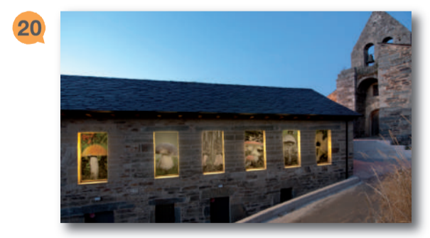
20 EMU (Escuela Micológica de Ungilde) Aquí conoceremos los diferentes hábitats existentes en la comarca y el papel ecológico que desempeñan los hongos en la naturaleza.