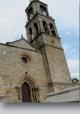
ERMITA DE SAN CAYETANO De estilo barroco, fue construida en el s. XVII por la familia Ossorio, cuyo escudo familiar se observa en la portada. El interior consta de una única nave dividida en dos tramos, la entrada con techo en bóveda de cañón, y el altar con una cúpula gallonada adornada por yesería. En ella se encuentran los pasos de la Semana Santa de Puebla, entre los que destaca el Cristo Resucitado conocido como Pinchatajas. Es una capilla-panteón dedicada al tema de la Resurrección.