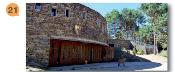
21 CENTRO TEMÁTICO DEL LOBO (Robledo) Espacio interpretativo dedicado al lobo ibérico en el que se tratarán diferentes aspectos como su biología, ecología, legado cultural y vida pastoril.